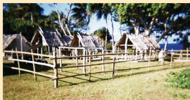
Les salles de classe