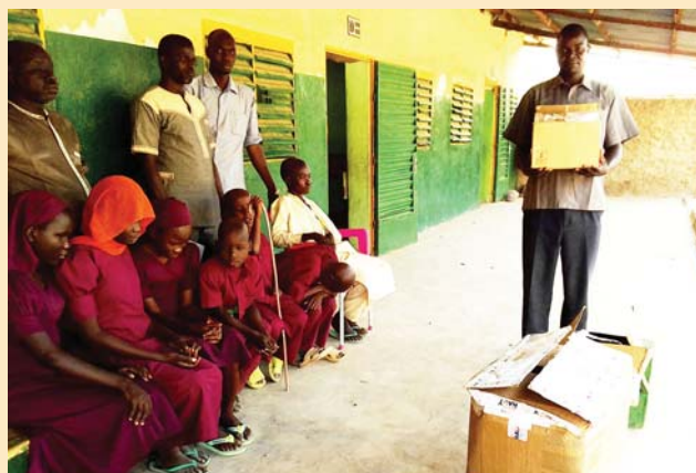
La distribution du matériel va commencer.

Le CA est reconnaissant de la vitalité de ses échanges avec ses partenaires au Vanuatu et au Tchad. Il lui revient de mettre en œuvre avec sagesse et discernement l'aide que nous pouvons leur apporter, dans la mesure des moyens qui nous sont dispensés.