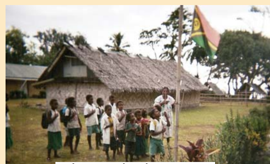
Lever du drapeau