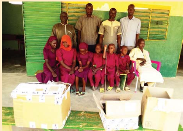
Arrivée des colis à l'école

Nous allons procéder à l'envoi d'une machine Perkins destinée à la traduction en braille de textes sur papier. C'est là aussi notre réponse à une demande du directeur de l'école.