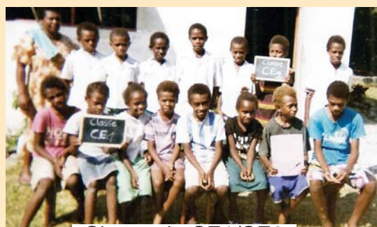
Classe de CE1/CE2