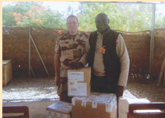
Aumônier protestant et le président des AET à la réception des colis de matériel pour l'école

Ce nouveau partenariat nécessite, tout comme les précédents, écoute et réflexion afin d'ajuster au mieux l'aide nécessaire.