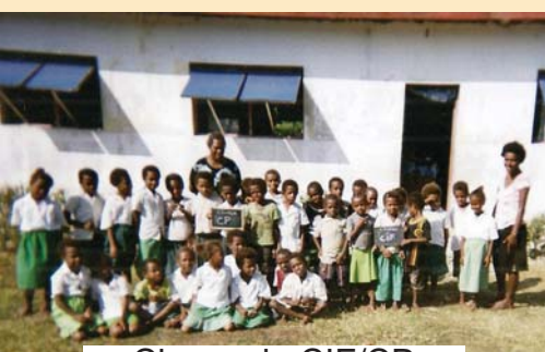
Classe de CIF/CP