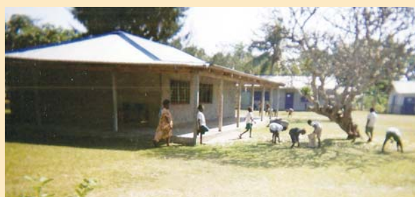
Le nouveau bâtiment de la bibliothèque presque terminé